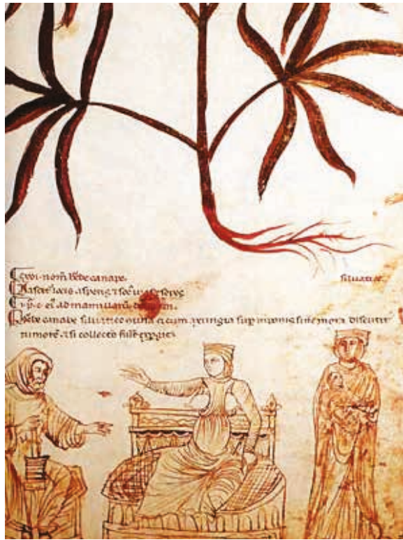
Ce manuscrit du IX e siècle, La Médecine antique , conseille d'utiliser le chanvre pour soigner les engelures.

Le cannabis médical peut être d'un grand secours pour certains enfants (notamment ceux qui sont atteints d'épilepsie).