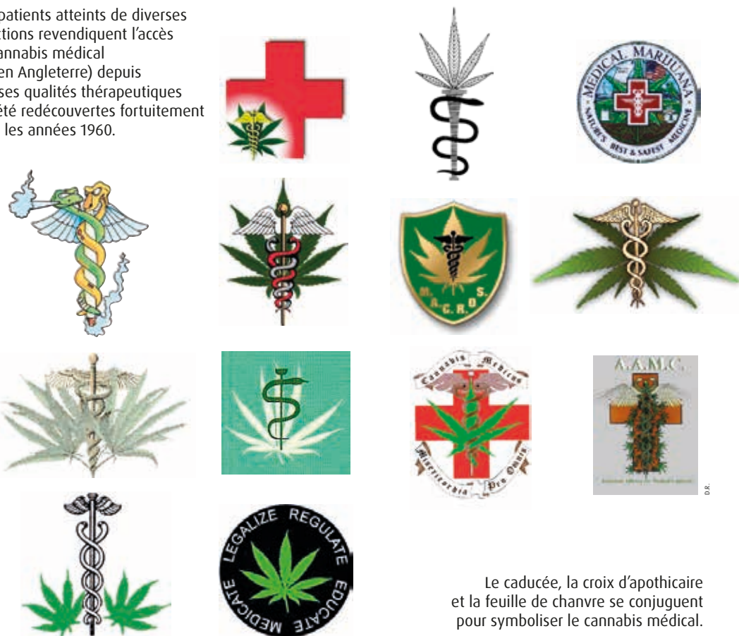
Le caducée, la croix d'apothicaire et la feuille de chanvre se conjuguent pour symboliser le cannabis médical.

Des patients atteints de diverses affections revendiquent l'accès au cannabis médical (ici, en Angleterre) depuis que ses qualités thérapeutiques ont été redécouvertes fortuitement dans les années 1960.